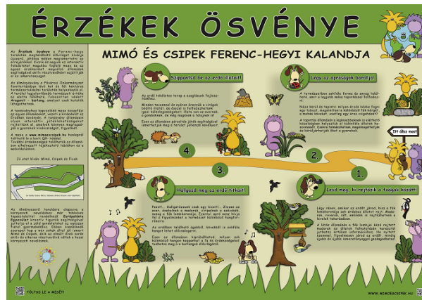
3. ábra Az Élményösvény nyitóablaja

A tervezés során esélyegyenlőségi szempontokat is figyelembe vettek. A tanösvény babakocsival és kerekesszéssel is járható. Az állomásokon található játékok részben tapintáson vagy halláson alapulnak, ezért többségükben vak- és gyengénlátó gyermekek számára is élvezhetőek. A tanösvényhez egy mesekiadvány kapcsolódik, mely összefűzi az egyes állomásokat és vezeti a kirándulót az állomások között, mesés történeti keretbe helyezve a kirándulás helyszíneit és a kiemelendő természeti értékeket. A mesében szereplő figurák irányítják a gyerekek figyelmét, 'megtanítják őket hallani, látni, érezni'. Tudatos természetjáró viselkedésük pedig észrevétlenül ragad rá a mese olvasójára és a túrán lépegető emberekre egyaránt. A meseszerű térkép ábrázolása lehetővé teszi, hogy a gyermekek maguk is tájékozódjanak a segítségével és felismerjék az állomások jellegzetes játékait.